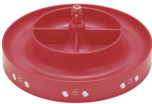
型號：DS-1023 品名：章魚燒宴會盤 規格：27x27x11.5cm