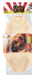
型號：DS-1013 品名：章魚燒木盤(10入) 規格：26x11x5.3cm