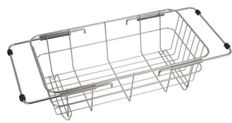
型號：DR-5432 品名：可伸縮水槽碗盤 瀝水架 規格：19.7x35.7x11.3cm