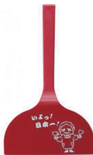
型號：DS-1024 品名：大阪燒尼龍鏟 規格：24x15x7cm(含包裝)