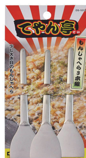
型號：DS-1012 品名：文字燒三鏟組 規格：13.1x3.4x0.1cm