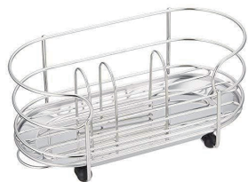
型號：DR-5316 品名：洗碗精海綿 放置架 規格：18.2x9.3x8.2cm