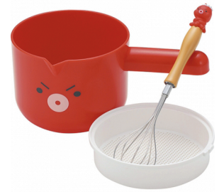
型號：DS-1021 品名：章魚造型麵糊 拌料盆組 規格：23.5x15.5x13cm