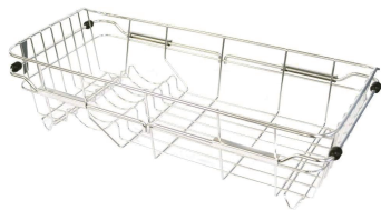
型號：DR-5323 品名：可伸縮水槽碗盤 瀝水架 規格：20.8x40x11.3cm