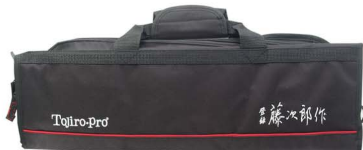
藤次郎刀袋 F-355 展開後尺寸：51 x 45 cm