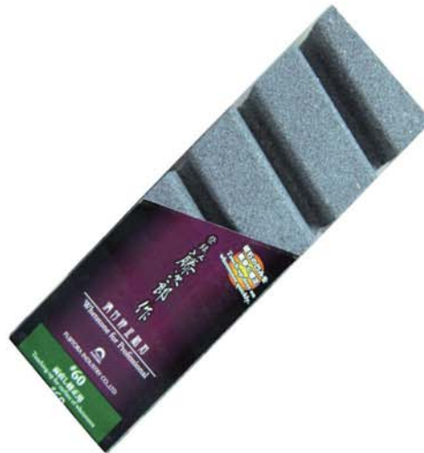
整平石(修護磨刀石) F-421 #60