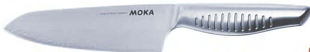
59101 大馬士革 三德鋼刀 (VG10) 180mm