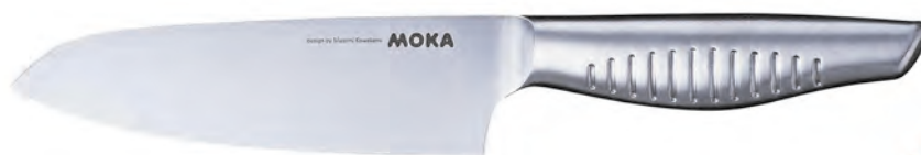
MK-03 一體成形 三德萬能刀 (鉬鈮鋼) 150mm