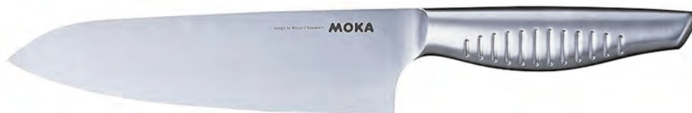
58701 鉬鈮鋼三德刀 180mm