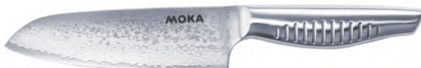
DMK-102 大馬士革 小三德鋼刀 (VG10) 150mm