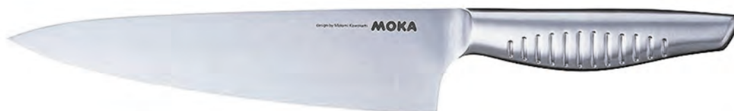
58601 鉬鈮鋼主廚刀 200mm