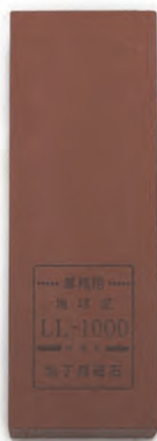
LL-1000 21x7x2.5cm 番數：1000