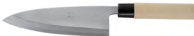
雞肉刀(左手)綠盒 16308 195mm