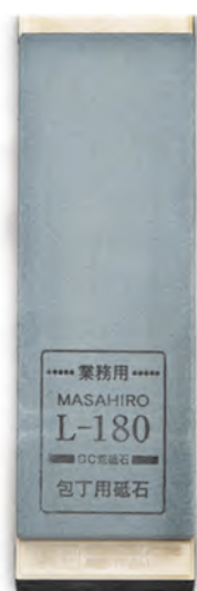
L-180附架 21x7x2.5cm 番數：180