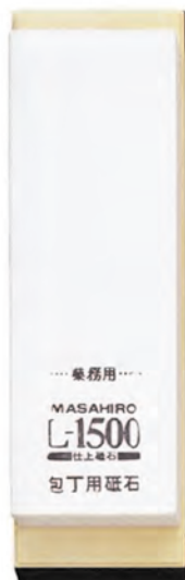
L-1500附架 21x7x2.5cm 番數：1500