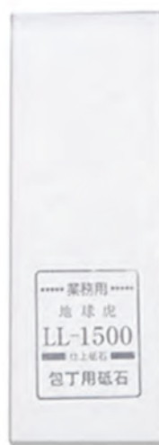
LL-1500 21x7x2.5cm 番數：1500