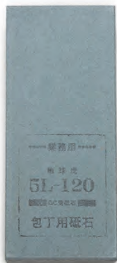
5L-120 23.5x10x7.6cm 番數：120