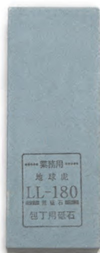
LL-180 21x7.3x6cm 番數：180