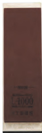
L-1000附架 21x7x2.5cm 番數：1000