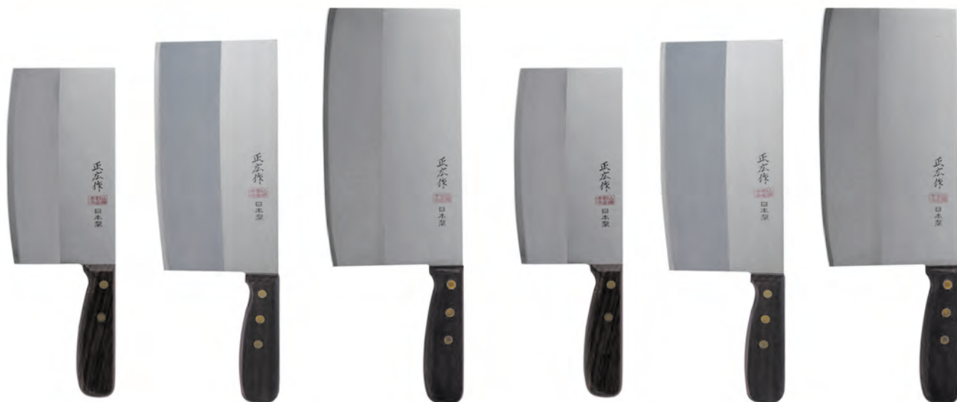
三合鋼片刀 薄 TX-101 175x88x1.6mm