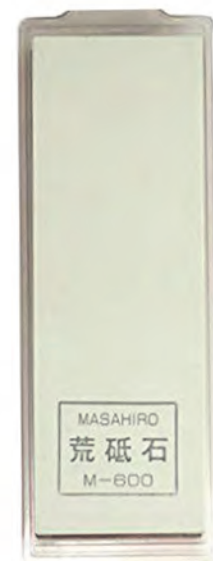
40173雙面 18.2x6x3cm 番數：600/1000