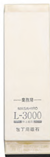
L-3000附架 21x7x2.5cm 番數：3000