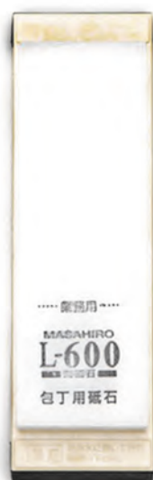
L-600附架 21x7x2.5cm 番數：600