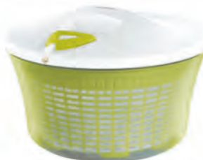
型號：L23200 品名：蔬菜脫水機 規格：29x19cm