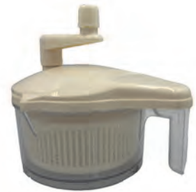
型號：DZ-0759 品名：蔬菜脫水器 規格：16(含柄寬21)x20cm