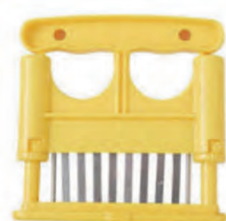
型號：MT-160Y 品名：單排肉筋叉 規格：13x13x2cm