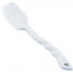
型號：DH-3013 品名：刮平刀 規格：25.8x5.5x1.1cm