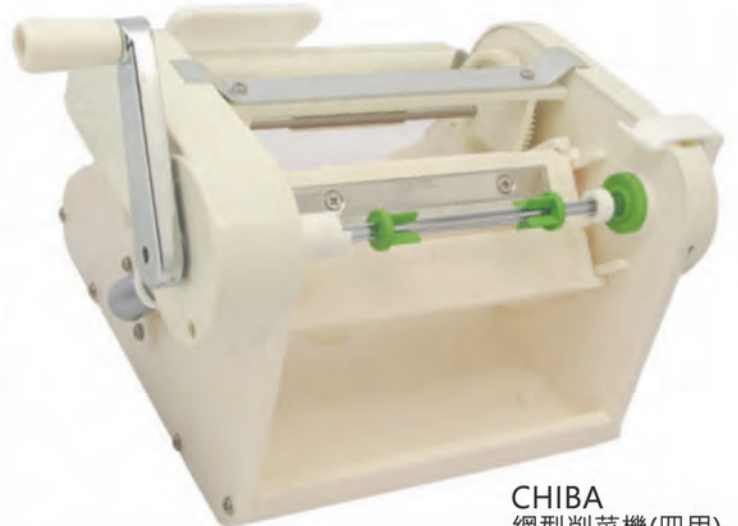
CHIBA 網型削菜機(四用) 24.5x23x17cm