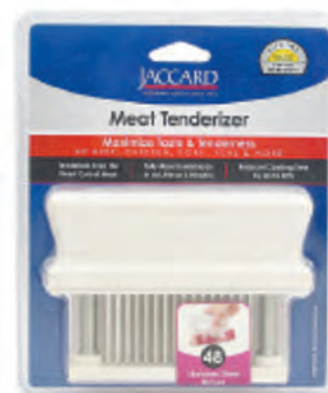
型號：200348 品名：營業用肉筋叉 規格：14.2x3.7x10cm