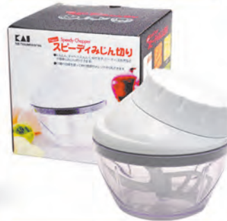
型號：DA-5032 品名：迷你蔬菜切碎器 規格：12x12.4cm