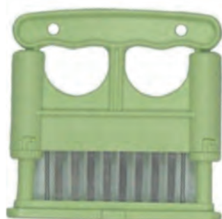
型號：MT-160G 品名：單排肉筋叉 規格：13x13x2cm