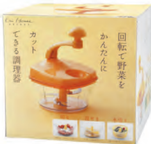
型號：DH-7220 品名：蔬菜脫水切碎機 規格：18.8x26cm