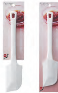
型號：DH-7111/7113 品名：刮平刀 規格：25x5.1x1cm(7111)/ 24.8x5.3x1cm(7113)