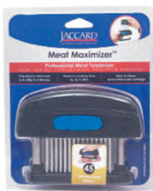
型號：200345NS 品名：營業用肉筋叉 (可拆式) 規格：15x4.4x11.5cm