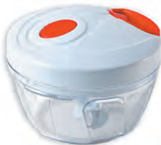
型號：HMA-01 品名：拉拉轉蔬菜切碎器 規格：12.5x9.5cm