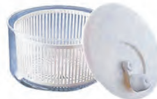
型號：SP1194 品名：蔬菜脫水器(小) 規格：19x12cm