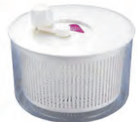
型號：SP1195 品名：蔬菜脫水器(大) 規格：26x16cm