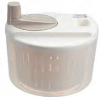
型號：DA-1210 品名：蔬菜脫水器 規格：22.5x17cm