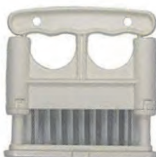
型號：MT-160W 品名：單排肉筋叉 規格：13x13x2cm