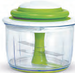
型號：102-239-011 品名：易拉轉蔬菜切碎器 規格：13.5x13cm