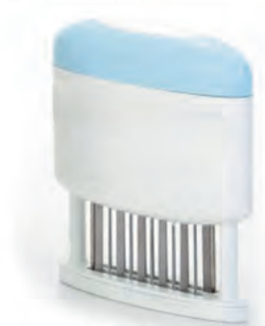
型號：10329 品名：2排肉筋叉(22針/藍) 規格：12.3x12.3x3cm