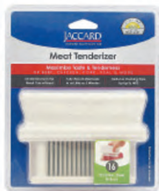
型號：200316 品名：1排肉筋叉(16針) 規格：14x2.6x10cm