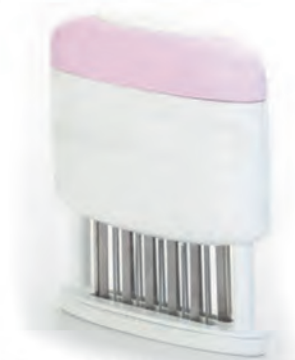
型號：10328 品名：2排肉筋叉(22針/粉) 規格：12.3x12.3x3cm